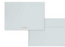
No.8766 霧 kiri