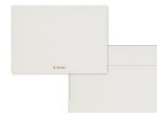
No.8768 雪 yuki