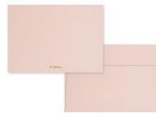
No.8765 桜 sakura