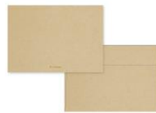
No.8767 楮 kouzo