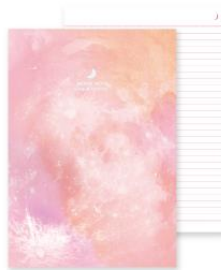
No. 8757 虹の入江