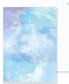
No. 8758 晴れの海